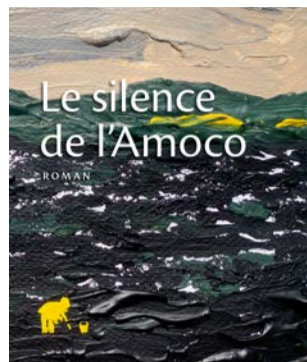
Le silence de l'Amoco Les îliennes éditions

« J'y ai greffé l'histoire d'une famille, celle d'un père marin-pêcheur, aidé de son fils aîné, alors que le plus jeune fils passe le bac. » Ce dernier, Julien est le personnage principal du roman, le narrateur quatre décennies plus tard d'une « mauvaise chimie » fami-