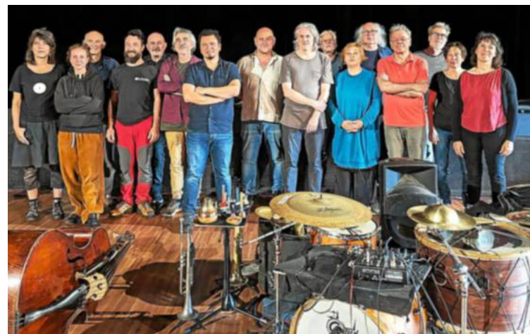
Dix-sept musiciens de tous horizons étaient réunis cette semaine pour une résidence d'artiste du UN Ensemble.

d'union, chacun d'entre eux marche à l'écoute, à la sensation renvoyée par l'autre musicien. « On recherche la plus grande liberté dans le temps, l'espace, les timbres, pour faire de la musique expérimentale », explique l'un des 17 musiciens. « Ça fait quatre ans que l'on fonctionne sous cette forme. C'est rare que l'improvisation se pratique en si grand nombre. Nous jouons tous dans d'autres formations, nous venons d'univers différents, classique, jazz... Cette variété se retrouve également dans nos âges ou nos régions d'origine. Trois à quatre fois par an, nous nous retrouvons pour performer, imaginer et créer, comme avec cette résidence », conclut un autre musicien.