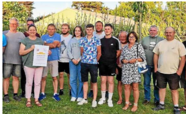
Les bénévoles de l'association Yaouankis assureront le parcours de la randonnée le samedi 8 juillet entre terre et mer.

● Pour le pardon du bourg de Trévoü-Tréguignec les 8, 9 et 10 juillet, l'association Yaouankis s'est réunie, mercredi, afin d'organiser et sécuriser la balade du samedi 8 juillet. Celle-ci, d'une durée de deux heures, longera des chemins de bords de mer et se prolongera dans la campagne.