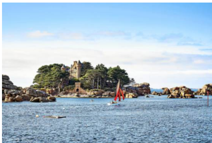
L'une des cartes postales emblématiques de la côte : le château de Costaérés, posé sur son îlot rocheux, en Trégastel et à quelques encablures de Ploumanac'h.

l'auteur de « Pêcheur d'Islande ». Alors, bonne lecture !